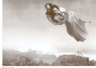
●2019年ヴェネチア国際映画祭 金獅子賞(監督賞) ●2019年ヨーロッパ映画賞 視覚効果スーパーバイザー賞 ●2020年スウェーデンアカデミー賞 美術賞

特撮を駆使したスタジオ撮影で、時にシャガールやレーベンの絵画も再現しながら、様々な小話が展開していく、スウェーデンの巨匠ロイ・アンダーソン最新作。ヴェネチア映画祭金獅子賞に輝いた前作「さよなら、人類」に続き、本作でも同映画祭で監督賞を受賞。