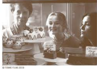
●2020年ヴェネチア国際映画祭 最優秀女優賞 ●2020年ヨーロッパ映画賞 視覚効果スーパーバイザー賞

洋菓子店の開店前に職人のサラが急死して、出資者たちは雲散霧消。共同経営者のイザベラと、サラの娘クラリッサに残されたのは、ノッティングヒルの工事前の店舗だけ。仲間を増やして開店にこぎつけるが、成功への道は…。小さな店に訪れた小さな奇蹟を描く。