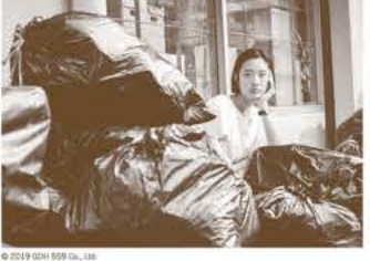
●2020年大阪アジア映画祭 最優秀作品賞

北欧に留学してミニマルなライフスタイルを学んだジーンは、バンコクの小さな実家ビルのリフォームを決意。しかし思い出の品々を捨てることができず、ひとつひとつ、もとの持ち主に返すことにするのだが…。不用意に過去と向き合った女性がたどる心の旅を描く。