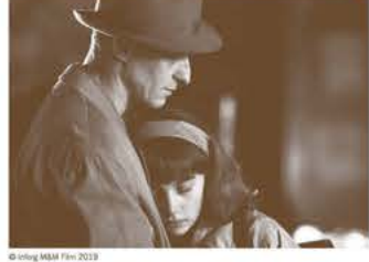
●2020年ハンガリーアカデミー賞 作品賞&監督賞&脚本賞 ●2020年ハンガリー映画批評家賞 主演女優賞 ●2020年ヨーロッパ映画祭 視覚効果スーパーバイザー賞

第2次世界戦争が終わり、ソ連の支配が強まってきたハンガリー。42歳の医師アルドは診察した16歳のクララの訪問を受ける。ホロコーストで家族を喪ったユダヤ人のふたりは、いつしかともに暮らし始める。時代に翻弄されながらも、癒されていく孤独な魂を描く。