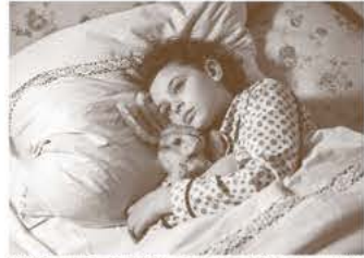
●2019年ヴェネチア国際映画祭 最優秀女優賞 ●2019年ヨーロッパ映画賞 視覚効果スーパーバイザー賞 ●2020年スウェーデンアカデミー賞 美術賞

ベルリンで批評家として活躍する父が、ナチス政権樹立に亡命を決意。9歳のアンナも大好きなぬいぐるみに別れを告げ、スイスの田舎に避難する。やがて一家はパリに向かい、アンナと兄は言葉の通じない学校に通うことに。児童文学者となった少女の自伝の映画化。