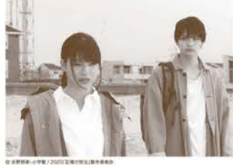
●2020年ヴェネチア国際映画祭 最優秀女優賞 ●2020年ヨーロッパ映画賞 視覚効果スーパーバイザー賞

東京に住む女子高校生の華蓮は、幼少期の記憶の断片が不意に脳裏をよぎり、意識が飛ぶことがある。あるとき戸籍抄本の記載に不審を抱いた華蓮は、失われた記憶を求めて、同級生と出生地の福岡へ向かう。学園ドラマが、次第に心理サスペンスに変貌していく。