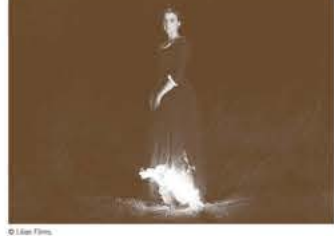
●2019年カンヌ国際映画祭 脚本賞&クィア・パルム賞 ●2019年シカゴ国際映画祭 ゴールデン・ヒューゴ賞&シルバー・クィービー賞 ●2019年ニューヨーク&ロサンゼルス映画批評家協会賞 撮影賞 ●2020年セザール賞 撮影賞

18世紀、プルトーニュの孤島に、ひとりの女性画家がたどりつく。彼女の仕事は、伯爵の娘の肖像画を描くこと。しかし娘は彼女の前に現れない。肖像画はミラノの貴族に送られ、結婚が決まるのだ。女性の自立が許されない時代に、自我を持ったふたりの女性の物語。