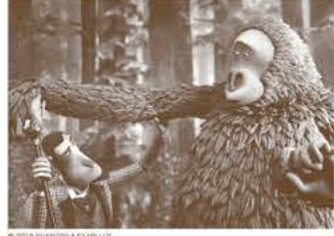
●2020年ゴールデン・グローブ賞 アニメーション映画賞 ●2020年アカデミー賞 長編アニメーション映画賞ノミネート

ヴィクトリア朝時代のイギリス。探検家の貴族フロストは未開の地アメリカで、人類進化の証拠となる“ビッグ・フット”に出会う。フロストはひとりぼっちの彼をヒマラヤの仲間のもとに送り届けようとするが…。ストップモーションアニメのスタジオライカ最新作。