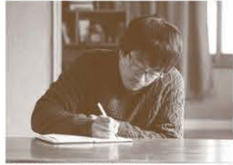
●2017年釜山映画批評家賞 脚本賞 ●2017年韓国女性映画祭 脚本賞

韓国有数の観光地済州島で生まれ育った詩人のテッキは、土産物屋を経営するしっかり者の妻とふたり暮らし。港にできたドーナツ店に通うようになった彼は、店員の青年に心惹かれる自分に気づく…。『息もできない』のヤン・イクチュン主演の切ないラブストーリー。