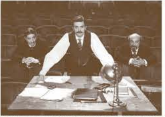
●2019年ヴェネチア国際映画祭 最優秀男優賞 ●2019年ヨーロッパ映画賞 視覚効果スーパーバイザー賞

妻子を抱え、スランプにあえぐ戯曲家エドモン・ロスタンと、大物俳優だが多額の借金を抱え、天下のコメディ＝フランセーズも敵に廻したコンスタン・コクラン。このふたりが出会い、100年後の今も上演される傑作「シラノ・ド・ベルジュラック」を誕生させる喜劇。