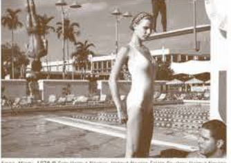
●2020年ヴェネチア国際映画祭 最優秀男優賞 ●2020年ヨーロッパ映画賞 視覚効果スーパーバイザー賞

ヘルムート・ニュートン(1920~2004)は、ベルリン生まれのユダヤ人。ナチスを逃れオーストラリアに渡り、パリでファッション写真家としてその美学を開花させた。時に女性蔑視とされた彼の被写体となった12人の女性たちの証言で稀代の写真家を浮き彫りにする。