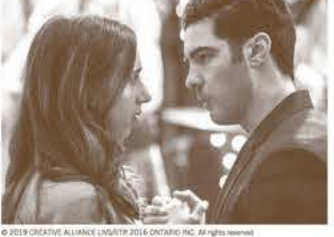
●2019年ベルリン国際映画祭 コンペティション部門オープニング作品

マンハッタンで古びたロシア料理店をランドマークに描かれる群像劇。常連客の看護師アリス。マネージャーに雇われたマーク。そしてDV夫から逃げてきたクララは、ふたりの息子とマンハッタンを巡るうちに無一文になる。フケありの人々を包み込む心温まる物語。